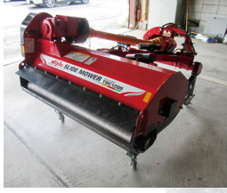
◀トラクター装着型