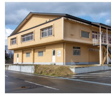
▲野沢体育館(町役場脇)