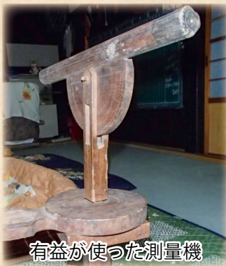
有益が使った測量機

当時としてはかなり高齢での就任だったと思われる。しかし間もなく、猪苗代近村での山野争いにおいて判断の誤りから処罰を受け、元禄元年（1688）10月、極入村に蟄居（屋敷の門を閉じ一室にこもらせる刑罰）を命じられたのです。しかしその間にも学問に勤しみ、暦学（当時までの暦日、日食・月食を調べ、のち『本朝統歴』としてまとめられました）や歴史の勉強を続けています。その際の歴史書『東国物語』全8巻も極入集落に遺されています。