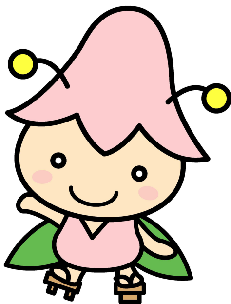
西会津町キャラクター「こゆりちゃん」