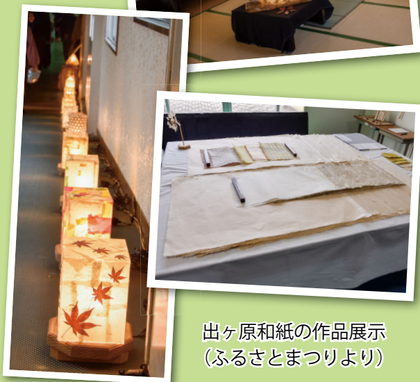
出ヶ原和紙の作品展示 (ふるさとまつりより)