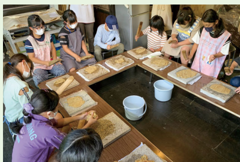
▲ 出ヶ原和紙作り体験