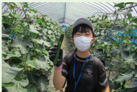
▲ 農林産物の収穫体験