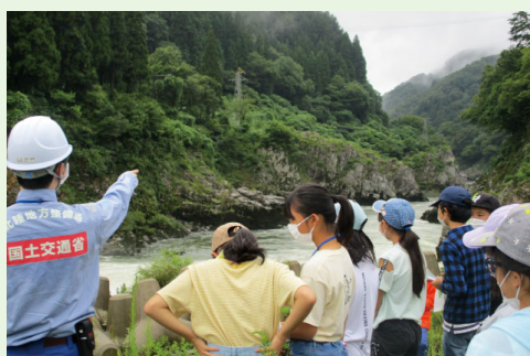
▲ 滝坂地すべり対策事業の見学