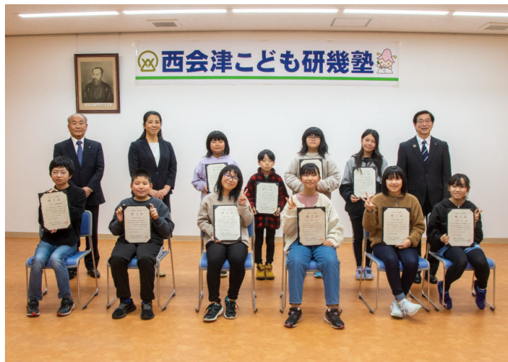
西会津子ども研幾塾第4期生 活動の足あと