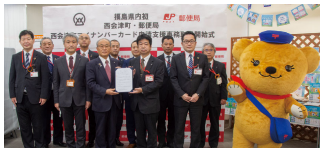
▲野沢郵便局での事務取扱開始式(12月1日撮影)

町では、日本郵便株式会社東北支社と連携し、県内で初となる郵便局でのマイナンバーカード申請支援事務の取り扱いを12月1日より開始しました。町役場まで申請に行くのが難しい場合は、最寄りの郵便局で申請手続きができますのでぜひ利用ください。