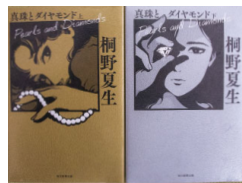
『真珠とダイヤモンド 上下巻』 [桐野 夏生 著] 毎日新聞出版