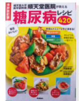
[河盛 隆造 著] Gakken