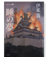
『一睡の夢』 [伊藤 潤 著] 幻冬舎