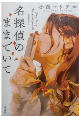
『名探偵のまままでいて』 [小西 マサテル 著] 宝島社