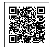
▲町ホームページ・事業者一覧表