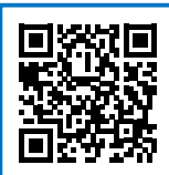
【令和5年4月1日以降の納付書の例】

納税方法は、クレジットカードやPay-easyなどです。本サイトでは、納付書に記載されているeL番号を入力するか、QRコードを読み取ると納付することができます。詳しくはホームページを確認ください。