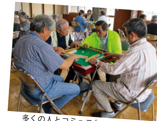
多くの人とコミュニケーション