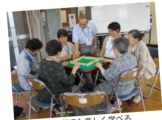
初心者でも楽しく学べる